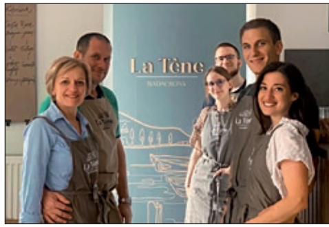
Vanília illatú álmok