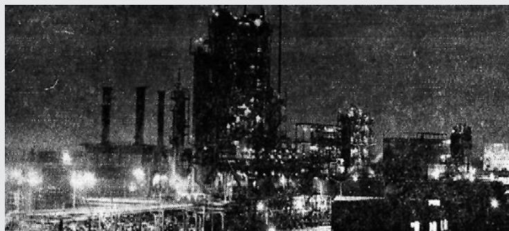
A Dunai Kőolajipari Vállalat éjszakai fényei

kőolajfinomító. Ez is eléggé elavult üzem már, korszerűsítését pedig elsősorban a műtrágyagyár soron következő nagyarányú rekonstrukciója teszi indokolatlanná. Pét állóeszköztétkkel arányos hatékonysága az elmúlt évben 6,5 százalékos