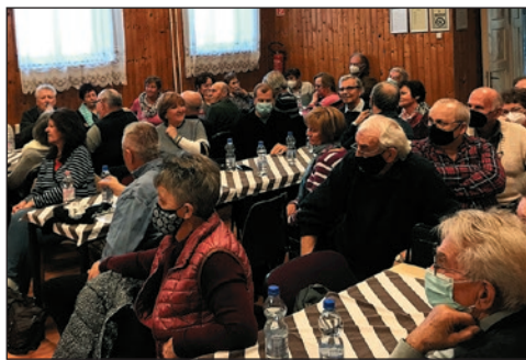
OMNYE: Otthon az Óvárosban