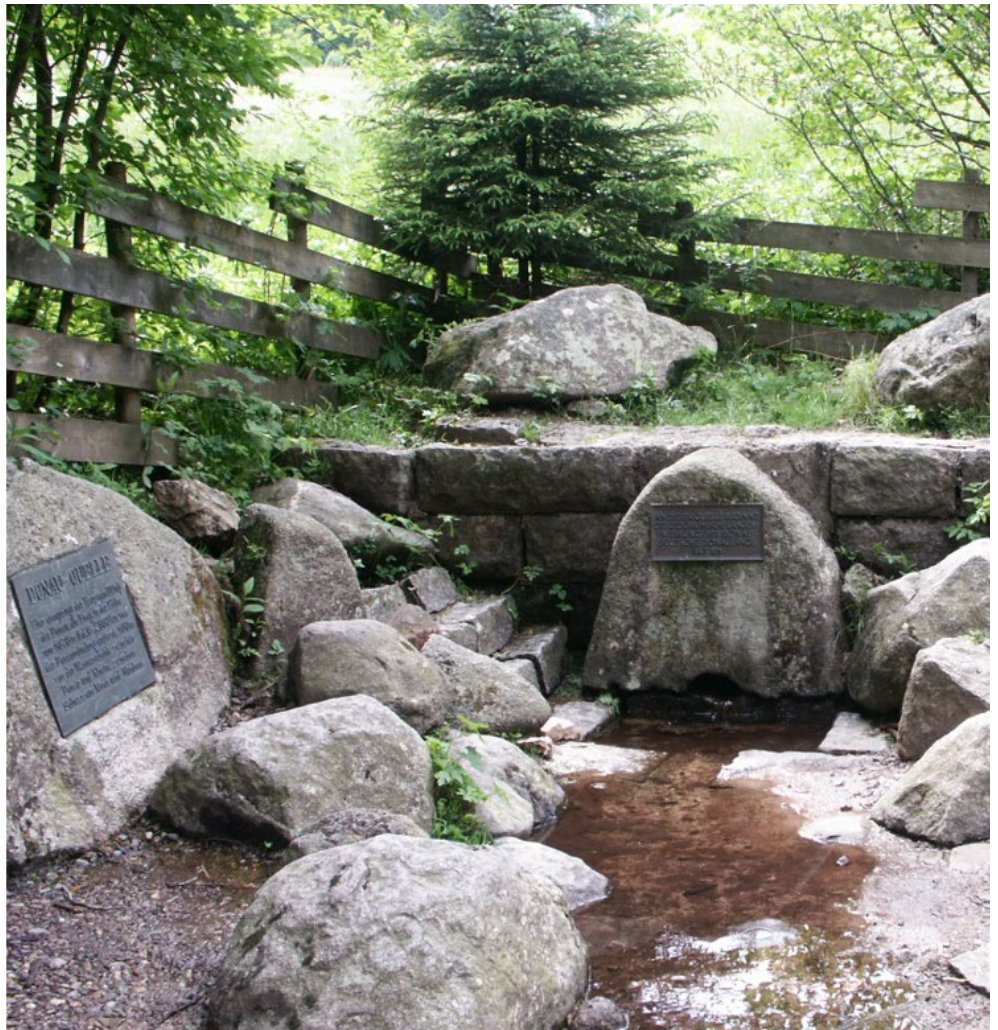
Innen már Duna lesz

Amikor gyerek voltam – édesapám volt a gátőr – mindennap „hivatalból” hallgattam a vízállásjelentést a rádióban, mekkora a Duna és mellékfolyói vízszintje a jellemző pontoknál. Hallottam fogalmakat, amik nem sokat jelentettek nekem akkor, nem feltétlenül értettem a tartalmát, mint pl. duzzasztott, gázlómélység, stb.