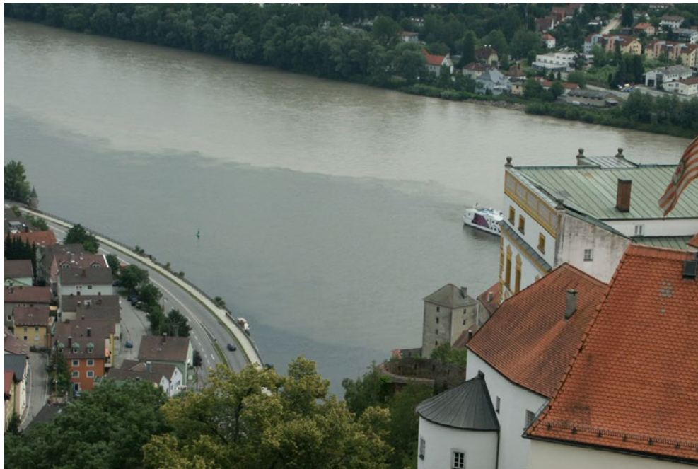
Passau, a három folyó

A Duna melletti kisvárosok szépek, a házaik gondozottak. Sok vízierőművet láttunk