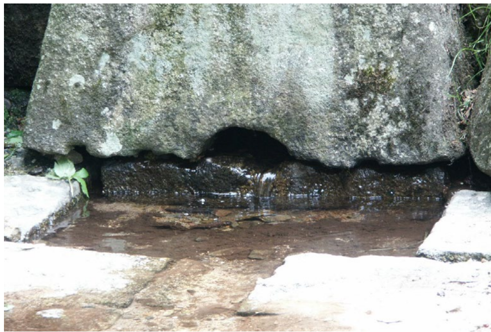
Forrás a Fekete erdőben

GPS-ünk nem volt akkor még, csak térképen tudtunk tájékozódni. Megtaláltuk rajta Donaueschingent, a Baden-Württemberg tartomány nyugati részén. Odamentünk. Akkor láttuk, hogy a Duna forrása tulajdonképpen egy szépen kiépített kút, amely a Fürstenberg hercegi-palota gyönyörű kertjében található. Weinbrenner allegorikus szobraival díszített a kút. A kastély 1772-ben épült és a XIX. század végén építették át.