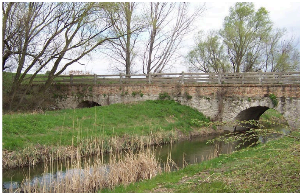
A „római híd”

Vízért az utca másik oldalára jártunk Versits bácsiék kútjára. Az udvarunkban viszont volt egy használaton kívüli istálló, ahol lelkesen kis nyulászatot létesítettem. Anyám úgy döntött és én is hajlottam rá, hogy nem változtatok az iskolámon. Így ősszel, a Bartók Béla úti iskolának én lettem a legmesszebbről járó tanulója. Reggel 6 órakor keltem. Busz vitt ki az állomásra és vonattal utaztam a Kelenföldi pályaudvar-