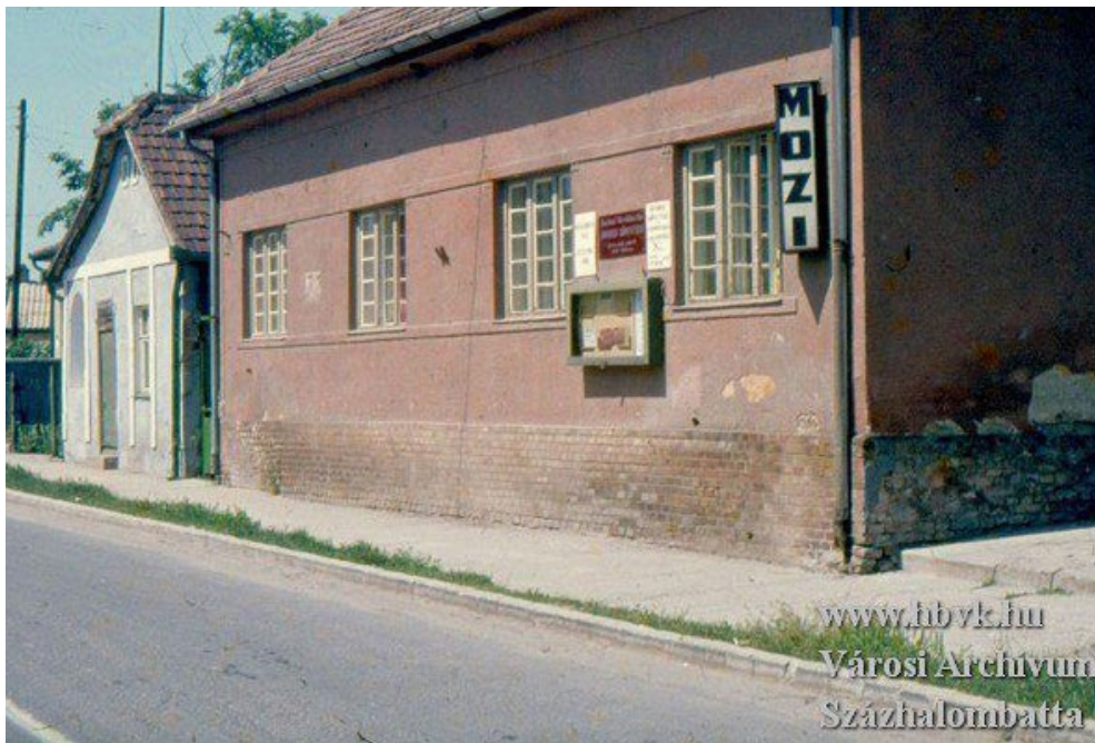
A közösségi ház