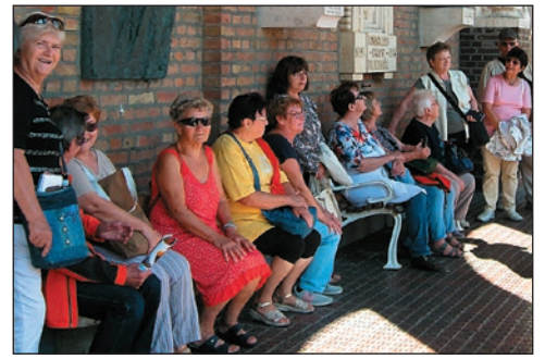
NYUPEK: Szeptemberben Szegeden