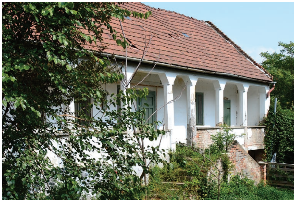
Tóth György egykori bíró háza

A tanár úr arcán kiült a döbbenet és megvetés kifejezése. Ezek után az osztály fele úgy rettegett a testnevelés órától, mint a matektól.