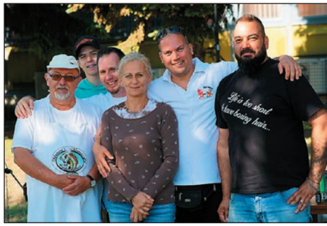
A képviselő naplója